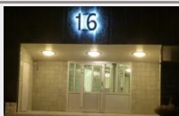
BILD Port på Norra Dragspelsgatan